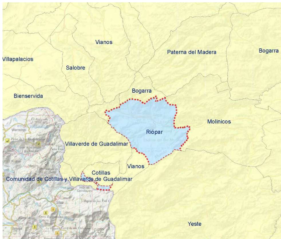
Figura 1. Término Municipal de Riópar. Al suroeste se identifica el enclave de Dehesa Angulo.

Está rodeado por los términos municipales de Bogarra, Alcaraz, Villaverde de Guadalimar, Vianos, Yeste y Molinicos. El municipio de Riópar se encuentra a una altitud de 920 metros sobre el nivel del mar.